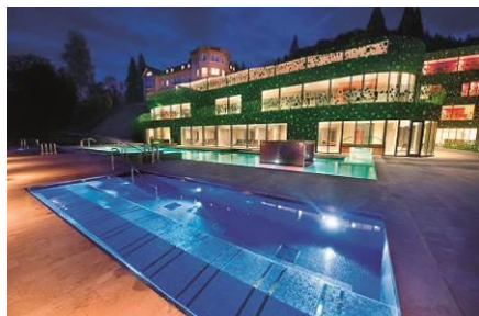
Hotel Rimski dvor ****

Hoteli Zdraviliški dvor **** / Rimski dvor **** / Sofijin dvor ****